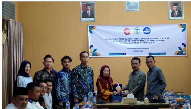
Gambar 2. Dokumentasi Penyerhan Cinder Mata dan Penandatanganan Perjanjian Kerjasama