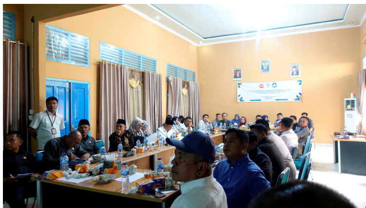
Gambar 3. Dokumentasi Penyampaian Materi dan Diskusi Bersama Seluruh Anggota DPRD

Adapun yang menjadi luaran program PPM ini, antara lain sebagai berikut: Perjanjian Kerjasama/Lisensi yang membuktikan produk/jasa dimanfaatkan oleh mitra, Dokumentasi kegiatan PPM berupa video, menghasilkan publikasi media massa cetak/online, publikasi pada jurnal nasional dan Pemakalah pada seminar lokal.