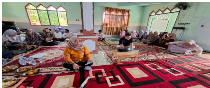
Gambar 2. Kegiatan Sosialisasi/Ceramah

Dengan adanya pengabdian ini dapat memecahkan masalah para santri bagaimana mengelola waktunya dengan baik dan benar, dapat membedakan kebutuhan dan keinginan, dan dapat memahami pentingnya manajemen waktu melalui edukasi pengabdian ini. Respon dari para guru dan para santri Yayasan RH La Tahzan, Cinangka, Depok – Jawa Barat, harapan sangat baik karena mereka sangat terbantu dengan adanya PKM dari para dosen Manajemen Universitas Pamulang, menambah pengetahuan dan pengalaman mereka mengenai manajemen waktu. Praktek langsung dengan memuat schedule list, membuat para santri termotivasi untuk memiliki keterampilan manajemen waktu karena banyak sekali manfaat yang didapat.