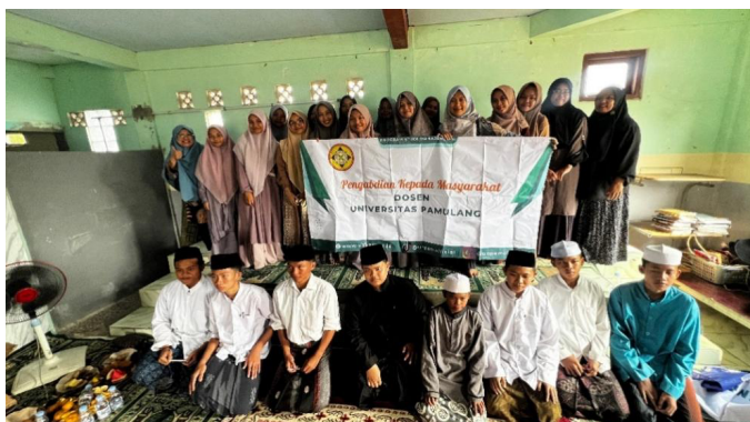
Gambar 5. Foto Bersama Setelah Pelatihan Selesai

Gambar 4 para siswa terlibat dalam diskusi terkait materi yang disampaikan untuk memecahkan berbagai masalah yang dihadapi, menjawab pertanyaan dan untuk membuat suatu keputusan. Para siswa saling bertukar informasi dan pengalaman terhadap sesama siswa sehingga memunculkan keberanian dan kepercayaan diri yang membuat siswa termotivasi untuk menabung. Kegiatan tanya jawab disertai games sehingga membuat siswa makin antusias dalam menjawab pertanyaan yang diajukan pemateri.