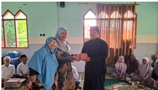
Gambar 4. Kegiatan Diskusi dan Tanya Jawab serta Games

Gambar 3 memperlihatkan kegiatan tutorial yang dilakukan secara lebih terarah dan pendampingan individual. Pada sesi ini, tim PKM membimbing santri dalam praktik penyusunan jadwal harian dan pengelolaan waktu secara sederhana sesuai dengan rutinitas mereka di pesantren. Metode tutorial memungkinkan santri untuk memahami materi secara lebih mendalam serta langsung mempraktikkan keterampilan manajemen waktu yang telah dipelajari.