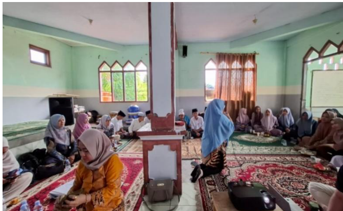
Gambar 3. Kegiatan Tutorial

Gambar 2 menunjukkan kegiatan sosialisasi dan ceramah yang dilaksanakan oleh tim PKM kepada para santri Yayasan RH La Tahzan. Pada tahap ini, santri diberikan pemahaman awal mengenai pentingnya manajemen waktu, manfaat pengelolaan waktu yang baik, serta dampak negatif dari penggunaan waktu yang tidak teratur. Antusiasme peserta terlihat dari keterlibatan aktif santri dalam menyimak materi dan merespons penjelasan yang disampaikan oleh pemateri.